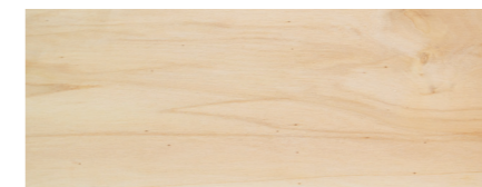
Beispiel Qualität BB