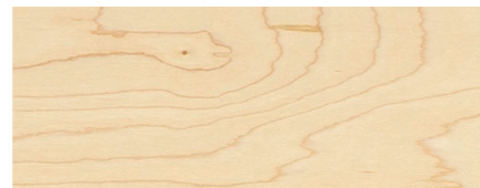
Beispiel Qualität BB