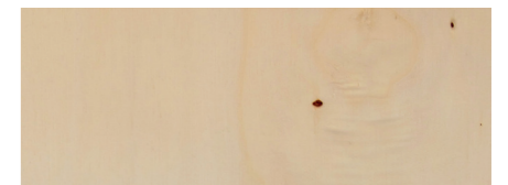
Beispiel Qualität BB