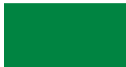
U 9561 Atlantikgrün •