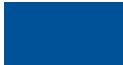
U 125 Atollblau •