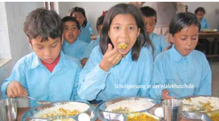
Schulspeisung in der Malekhuschule